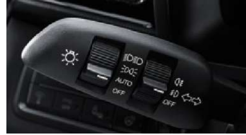
Otomatik far kontrolü