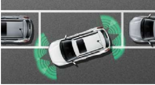
Park asistanı (űn & arka)