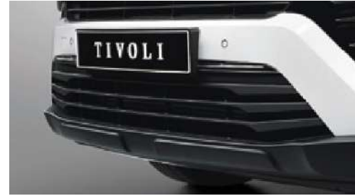
Hava giriŐ ızgarası