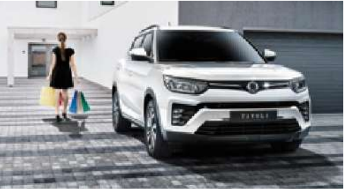
Otomatik kapı kilitleme sistemi