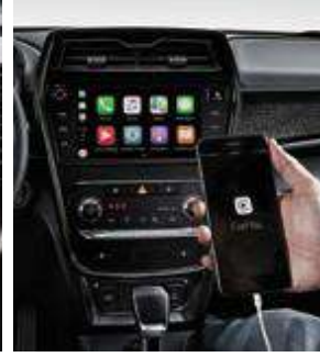
AVN sistemi / geri görüş