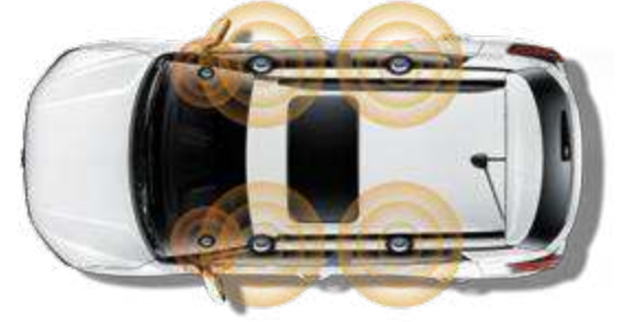
6 hoparlör (4 kapı hoparlör, 2 ön tweeter)