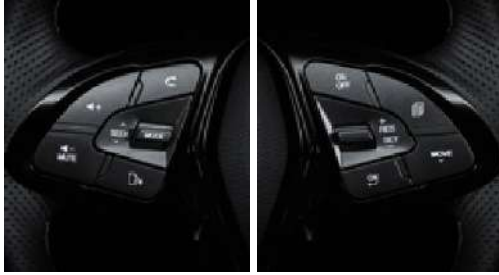
Hands-free ses düğmeleri / Hız sabitleyici düğmeleri