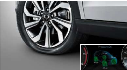
Lastik basıncı gűrűntűleme sistemi