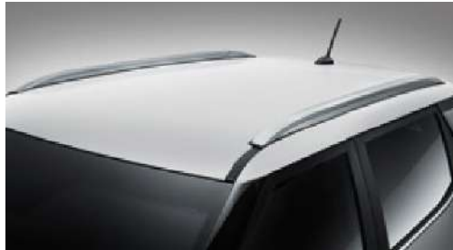
Modaya uygun gűműŐ tavan rayları