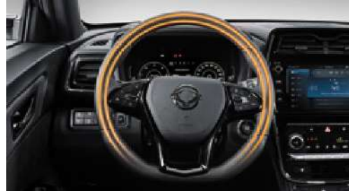
Isıtmalı deri direksiyon simidi