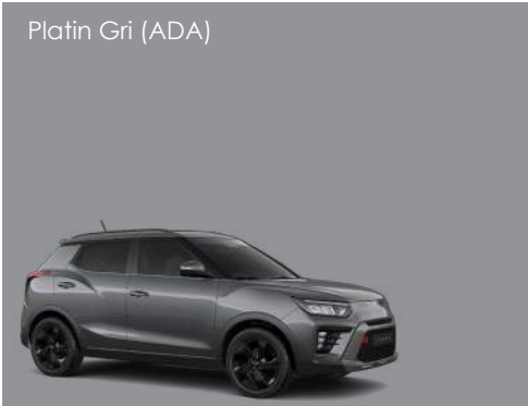
Platin Gri (ADA)