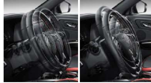
Teleskopik ve eğimi ayarlanabilir direksiyon kolonu