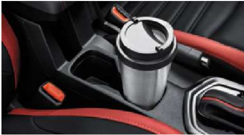
Orta konsol bardaklıklar