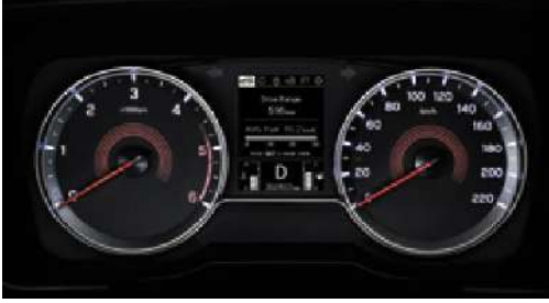
Standart gösterge paneli