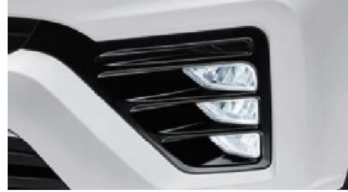
LED sis lambaları (űn ve arka)