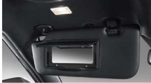
Işıklı makyaj aynası