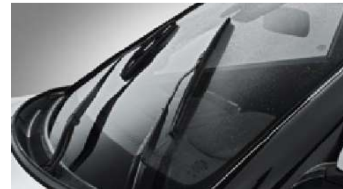
Aero tip silecekler