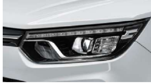
LED űn ve arka far