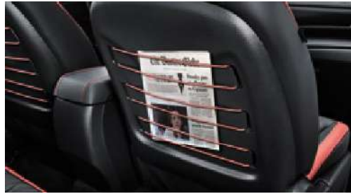
Koltuk arkası cebi