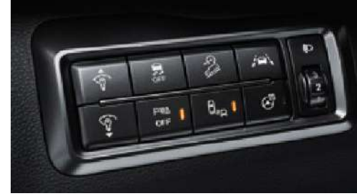
Çoklu düğme konsolu